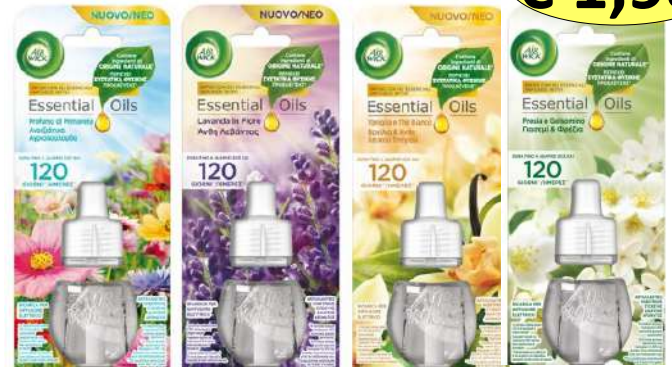
220071 - 220097 - 220098 - 220650 DEOD RICARICA ML.19 X ELETTRICO