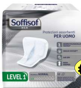
030696 MEN ASSORBENTI X 12 LEVEL 1