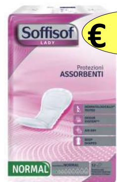
030704 ASSORBENTI LADY NORMAL X 12 PZ.