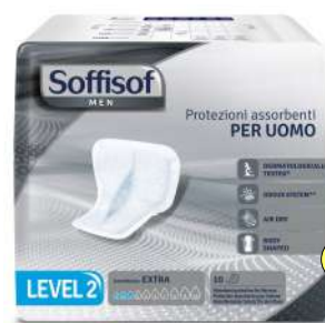
030697 MEN ASSORBENTI X 10 LEVEL 2