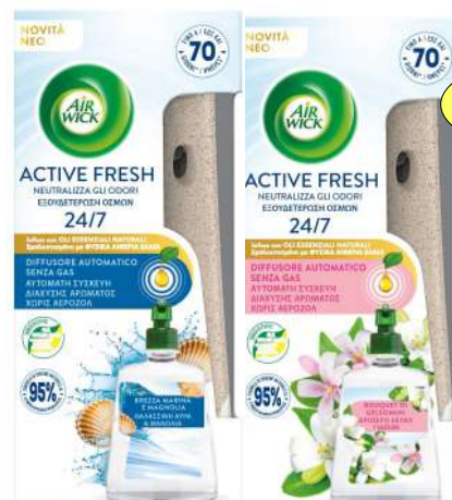
220274 - 220275 DEOD.ACTIVE FRESH AUTOM NO GAS ML .228