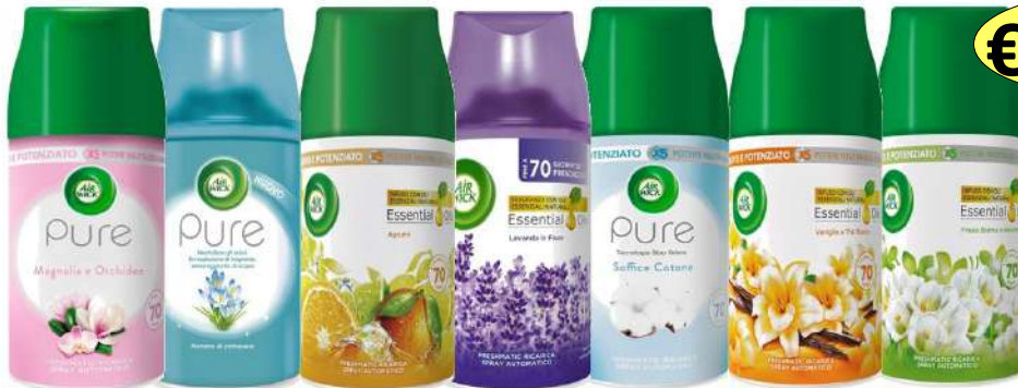
220034 - 220066 - 220072 - 220073 - 220074 - 220093 - 220094 DEODORANTE FRESH MATIC RICARICA ML.250