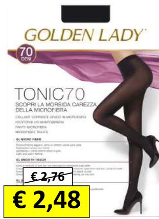
421272-421273-421274 GOLDEN TONIC 70 D NERO