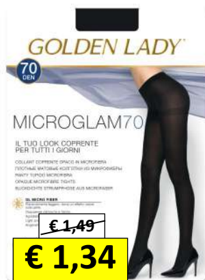
420282-420283-420286-420287 GOLDEN MICROGLAM 70