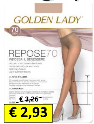
DAL 421553 AL 421585 CALZE REPOSE 70 D