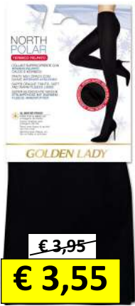
421324-421325-421326 COLLANT NORTH POLAR NERO