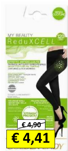
420595-420597 GOLDEN REDUXCELL 120/D