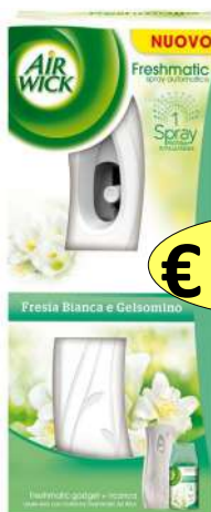
220087 DEOD. FRESH MATIC COMPL FRESIA