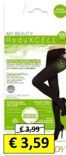
DAL 420581 AL 420588 GOLDEN REDUXCELL 100/D