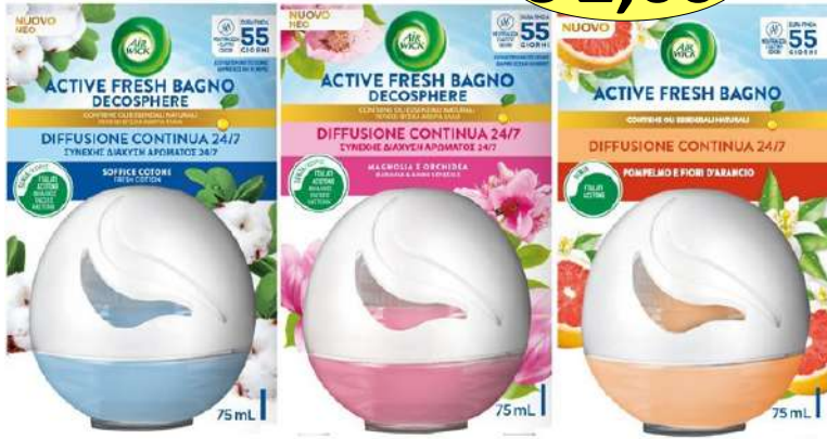
220035 - 220036 - 220037 DEOD. BAGNO SFERA ML.75