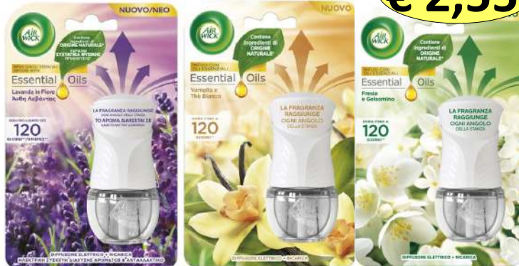
220061 - 220062 DEOD. FORNELLO ELETTRICO COMPL