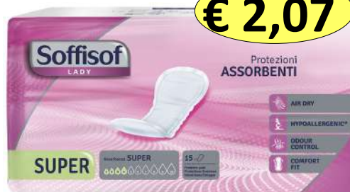
030710 ASSORBENTI LADY SUPER X 15 PZ.