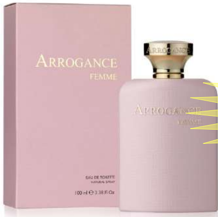
552032 ROSA FEMME EDT ML.100 SPRAY

ACQUISTANDO 1 PEZZO (DAL P.D.L.) IN OMAGGIO 1 ARROGANCE DONNA DOCCIA GEL ML.200