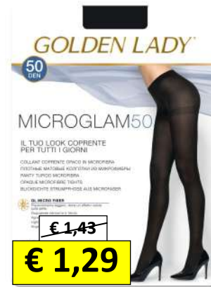
420380-420381-420382-420383 GOLDEN COLLANT MICROGLAM 50