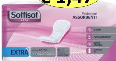
030706 ASSORBENTI LADY EXTRA X 10 PZ.