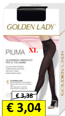
421380 GOLDEN PIUMA CALDOMORBIDO XL