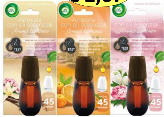
220044 DEOD DIFFUS RICAR OLI ESSENZIALI ML.20 MISTO