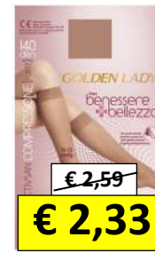
DAL 422330 AL 422335 GOLDEN BENESSERE GAMBALETTA 140 D