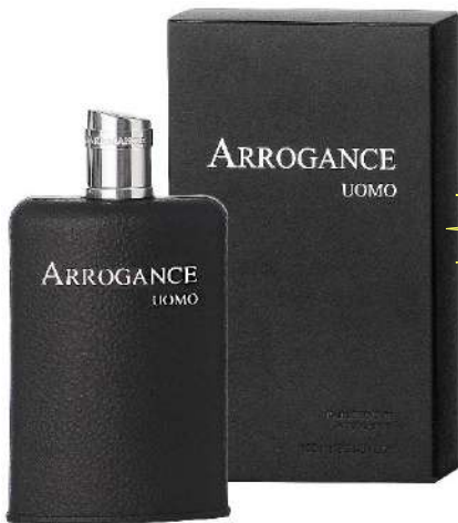
552036 UOMO GRIGIO EDT ML.100 SPRAY

ACQUISTANDO 1 PEZZO (DAL P.D.L.) IN OMAGGIO 1 PEZZO DI ARROGANCE GRIGIO UOMO DOCCIA ML.200 HAIR BODY