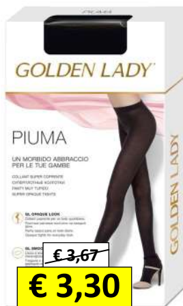
421378-421379 GOLDEN PIUMA CALDOMORBIDO