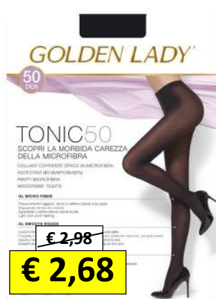
421307-421308-421309-421310 GOLDEN TONIC 50 D NERO